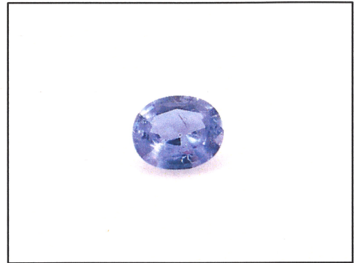
Dieses Bild dient nur der Identifikation und stellt nicht die Originalgröße bzw. die tatsächliche Farbe dar.