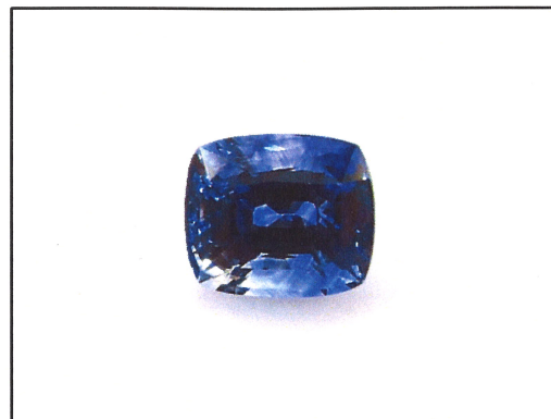
Dieses Bild dient nur der Identifikation und stellt nicht die Originalgröße bzw. die tatsächliche Farbe dar.