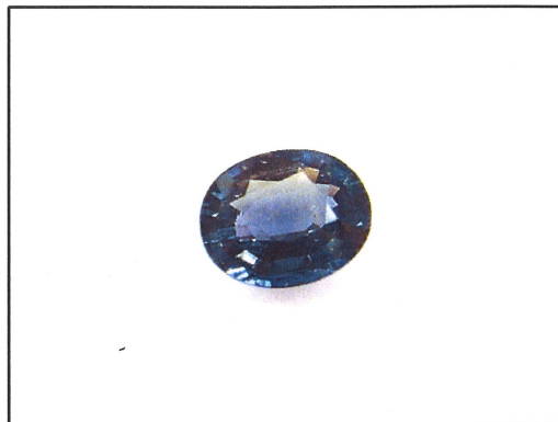
Dieses Bild dient nur der Identifikation und stellt nicht die Originalgröße bzw. die tatsächliche Farbe dar.