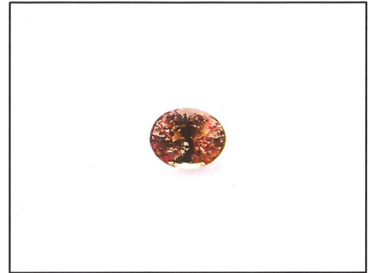
Dieses Bild dient nur der Identifikation und stellt nicht die Originalgröße bzw. die tatsächliche Farbe dar.