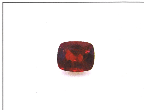
Dieses Bild dient nur der Identifikation und stellt nicht die Originalgröße bzw. die tatsächliche Farbe dar.