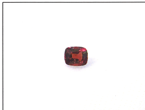
Dieses Bild dient nur der Identifikation und stellt nicht die Originalgröße bzw. die tatsächliche Farbe dar.