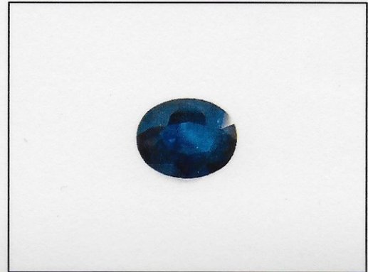
Dieses Bild dient nur der Identifikation und stellt nicht die Originalgröße bzw. die tatsächliche Farbe dar.