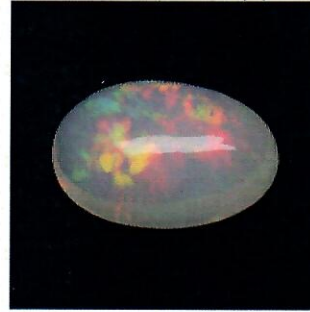
Picture is not actual size. The color of the item(s) and the color of the picture may be different.