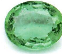
Picture is not actual size. The color of the item(s) and the color of the picture may be different.