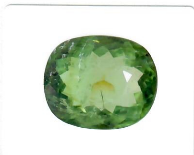
See terms and conditions on reverse